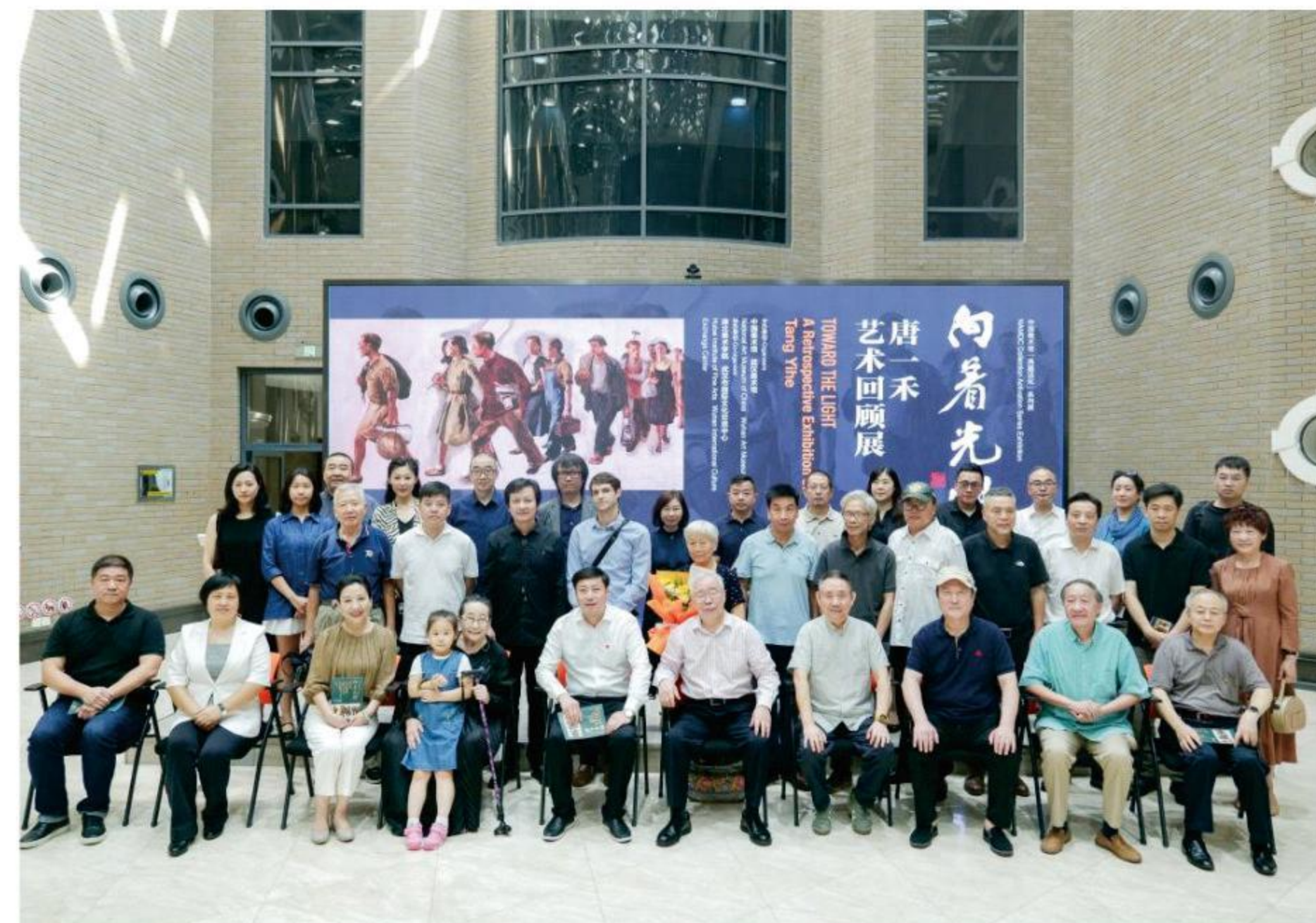
开幕式现场嘉宾合影