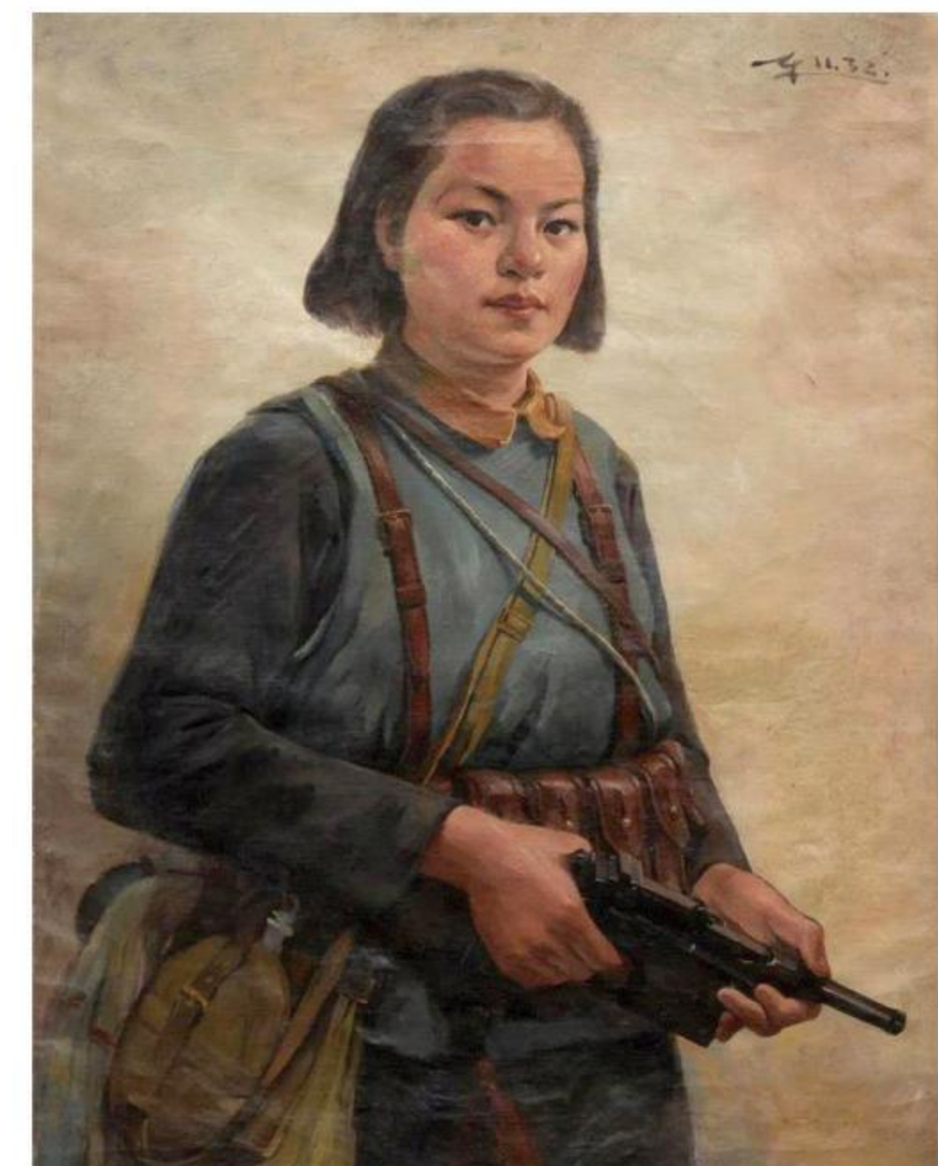
《女游击队员》唐一禾油画